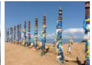
Heilige Stehlen und Steine

NIEMAND ERWARTET IM TIEFEN SIBIRIEN EIN BUDDHISTISCHES KLOSTER. ABER HIER IN IVOLGINSK IST DAS GRÖßTE, BUDDHISTISCHE KLOSTER UND DIE EINZIGE LAMAISTISCHE SCHULE IN RUSSLAND