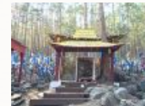
Kultstätte einer Heiligen

IMMER WIEDER AUF UNSERER REISE WERDEN WIR HALT MACHEN AN HEILIGEN PLÄTZEN, DIE DURCH BUNTE BÄNDER GEEHRT WERDEN. MAN SUCHT SIE AUF UM MIT DER ANDERWELT IN KONTAKT ZU TRETTEN, BITTET UM HILFE UND BEISTAND ODER DANKT FÜR EMPFANGENE GABEN.