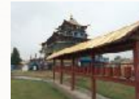
Zeit um den inneren Raum zu betreten

NIEMAND ERWARTET IM TIEFEN SIBIRIEN EIN BUDDHISTISCHES KLOSTER. ABER HIER IN IVOLGINSK IST DAS GRÖßTE, BUDDHISTISCHE KLOSTER UND DIE EINZIGE LAMAISTISCHE SCHULE IN RUSSLAND