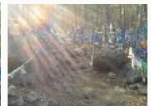
Hier segnet der Himmel den Ort