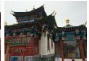
Mit Liebe gestaltetes Kloster

IMMER WIEDER AUF UNSERER REISE WERDEN WIR HALT MACHEN AN HEILIGEN PLÄTZEN, DIE DURCH BUNTE BÄNDER GEEHRT WERDEN. MAN SUCHT SIE AUF UM MIT DER ANDERWELT IN KONTAKT ZU TRETTEN, BITTET UM HILFE UND BEISTAND ODER DANKT FÜR EMPFANGENE GABEN.